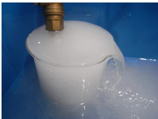
写真1 マイクロナノバブル水