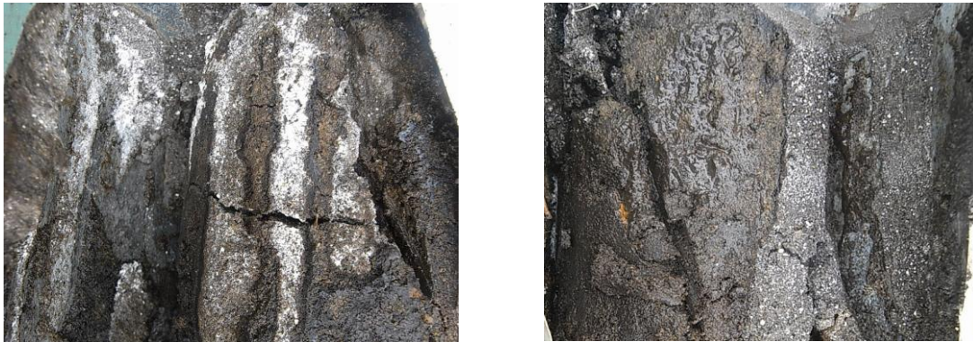
写真5 土壌断面（左：水+消石灰、右：MNB+消石灰）

今回の実験ではEC、硝酸イオン濃度ともMNB+消石灰の方が小さく、除塩効果が大きいがわかる。なお表層のECがどちらも高い理由は、塩類の他に消石灰もEC（電気伝導度）に反応するからである。消石灰は除塩するが表土に残るため強アルカリ性になりしばらく栽培はできないという欠点がある。土壌の断面（写真5）を見ても水では消石灰が上部に残っているのがわかる。しかしMNBは中まで染み込み、散布した消石灰をよく洗い流していることから、早く栽培が可能になると想像できる。