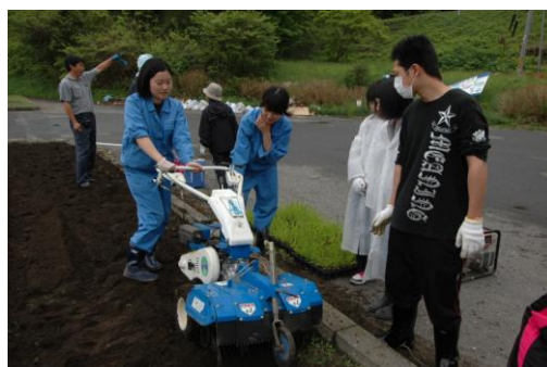
写真8 山田町の花壇再生活動 (5月)