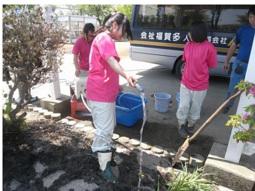
写真9 浜市川保育園の花壇再生活動 (6月)